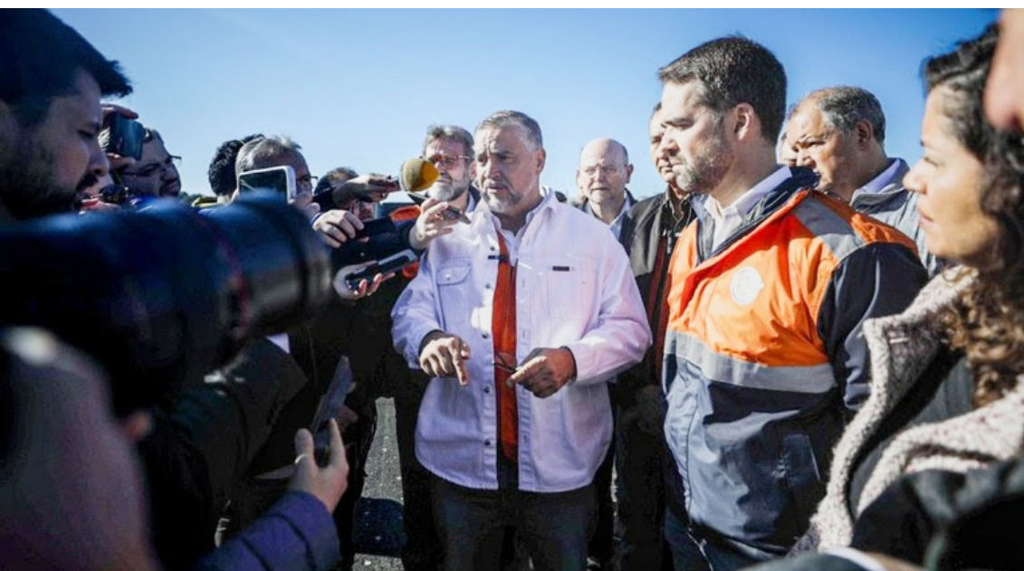
O ministro Paulo Pimenta (Secom) ao lado do governador do Rio Grande do Sul, Eduardo Leite: prioridade ao salvamento de vidas.

Comitiva de ministros visita o Rio Grande do Sul, articula ações de salvamento e resgate com helicópteros e botes e auxilia municípios a determinar investimentos necessários para recuperação de estruturas e prejuízos materiais