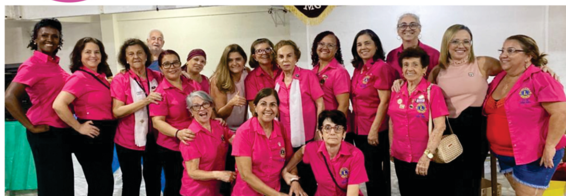
CCaLL do Lions Clube Muriaé Helen Keller que trabalharam no Bingo Beneficente