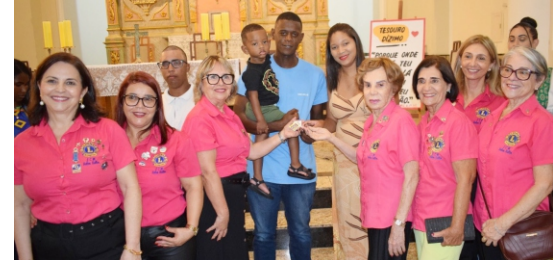
Lions Clube Muriaé Helen Keller entregando a chave para uma família